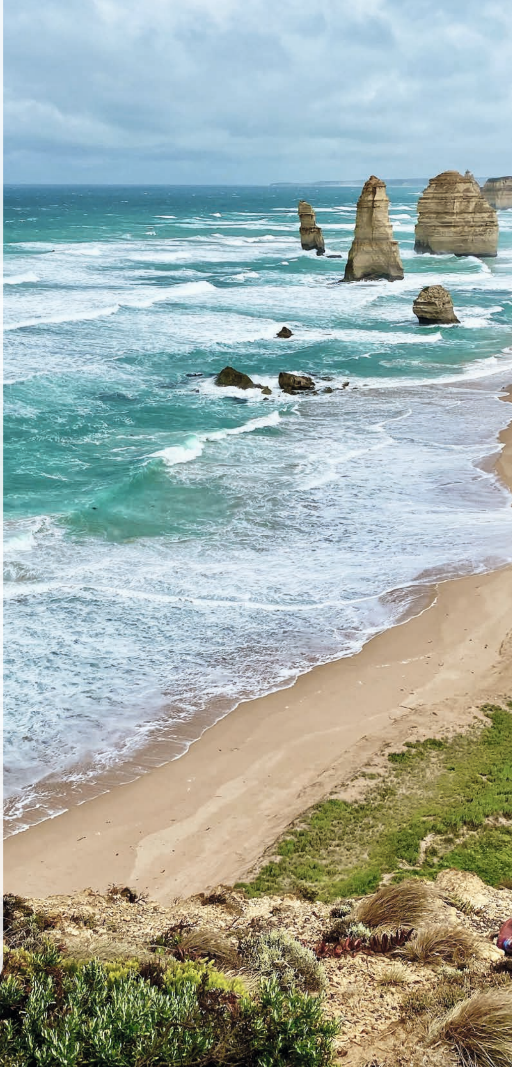
Foto: Australische kust