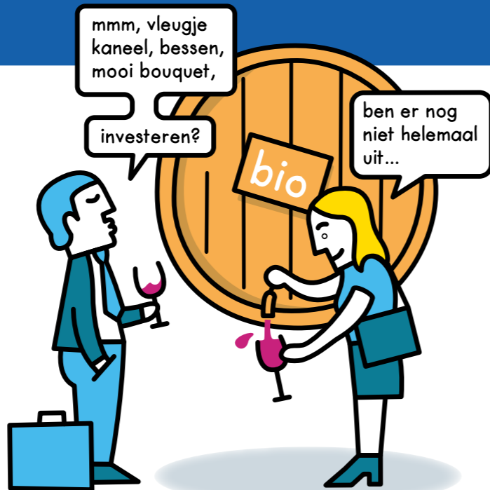
'Actief bijdragen aan duurzame economische groei.'

willen we scherper afwegen waar we precies in beleggen, waarbij we aansluiting zoeken bij internationale afspraken zoals het UN Global Compact. Hoe we dat laatste precies gaan doen, zullen we nog verder uitwerken.'